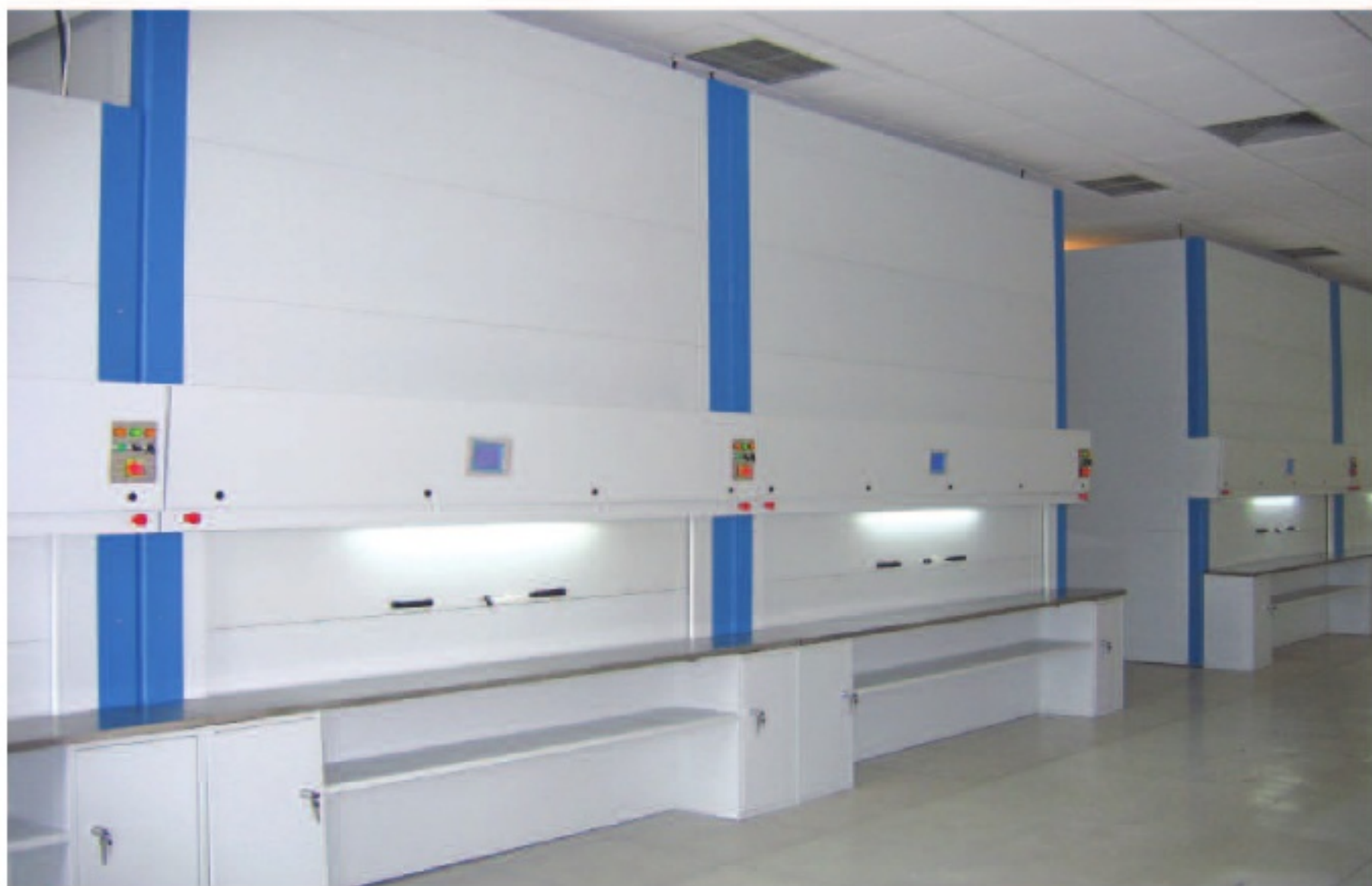
▲ 实际使用中的数控垂直回转库