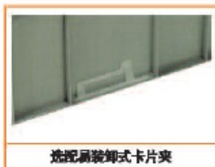
选配扇装卸式卡片夹