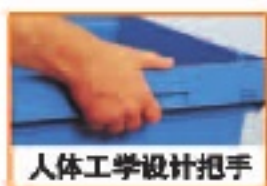
人体工学设计把手