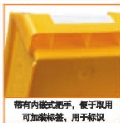
带有内嵌式把手，便于取用 可加装标签，用于标识