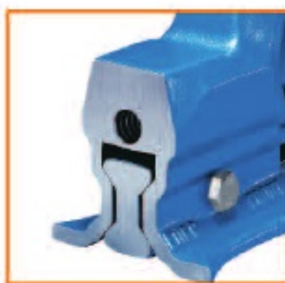
▲ 可调的双V形加工面导向