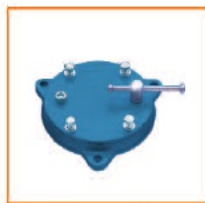
▲ 360° 回转底座